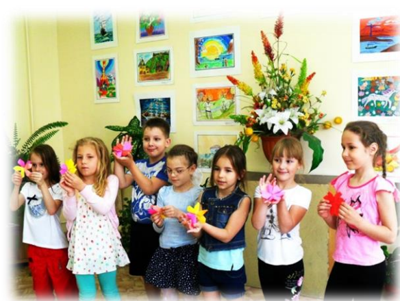
16 июня -День истории России. Посещение картинной галереи.